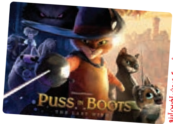
گربه چکمه‌پوش آخرین آرزو