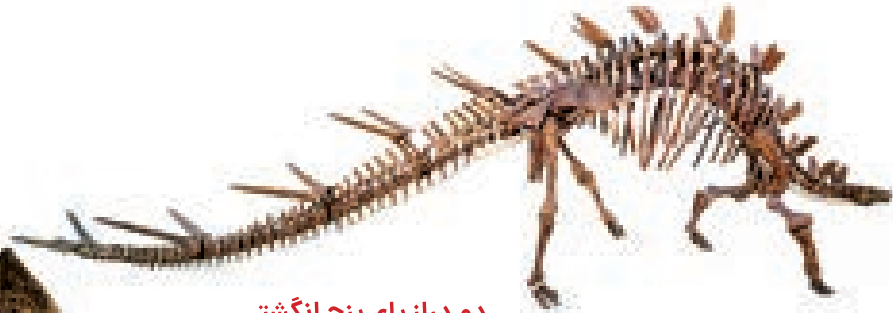
دم دراز پای پنج انگشتی قفس دنده

تنداگورو، در جنگل‌های خشک تانزانیا در آفریقا، مکانی است که به خاطر فسیل‌های دایناسورها مشهور است. دو اسکلت کامل از کنتروسورس از حدود ۹۰۰ استخوان یافت شده در آنجا جمع‌آوری شده است.