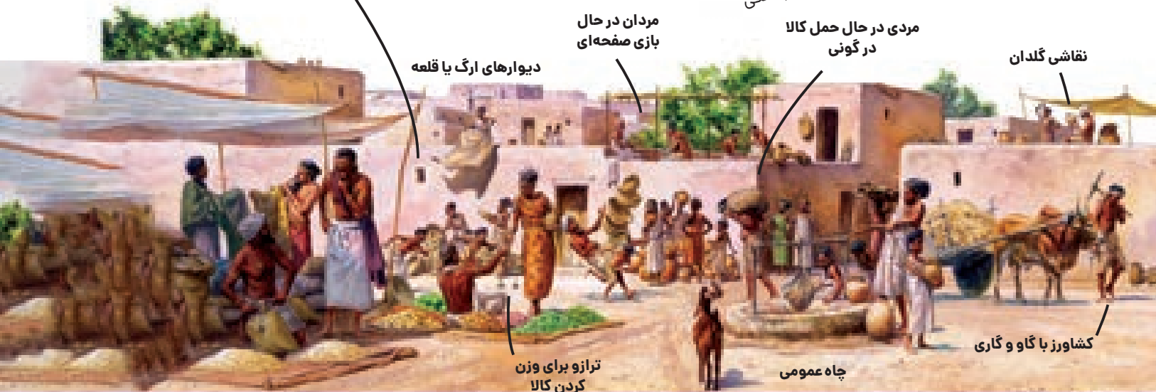
دیوارهای ارگ یا قلعه