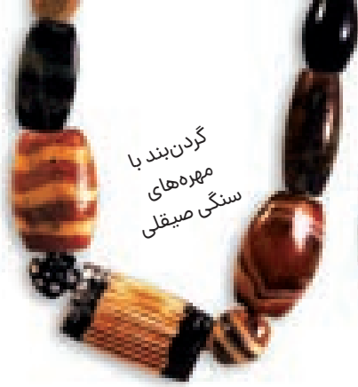
گردن‌بند با مهره‌های سنگی صیقلی